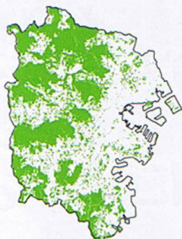
[30年前の横浜の緑]1980年 (緑被率: 約40%)