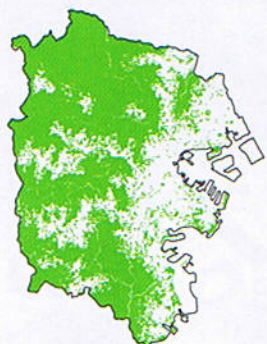
[40年前の横浜の緑]1970年 (緑被率: 約50%)