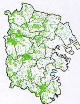
[現在の横浜の緑]2004年 (緑被率: 約31%)