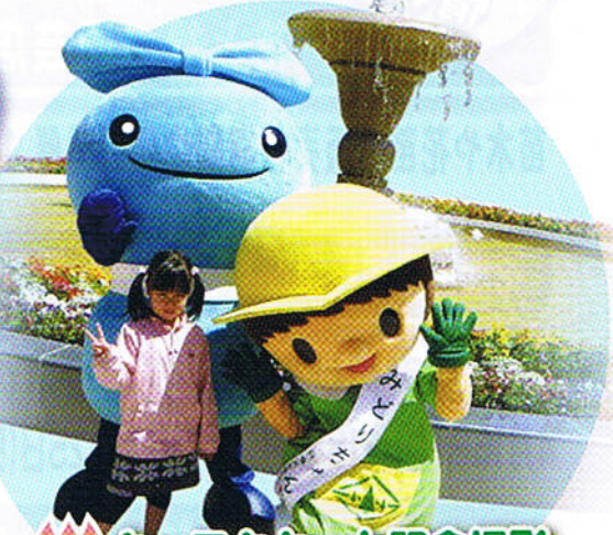
キャラクターと記念撮影