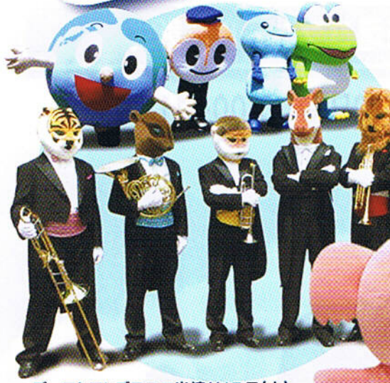
ズーラシアンブラスの出演は17日(土)