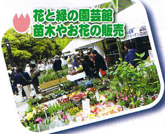
花と緑の園芸館 苗木やお花の販売

4/16金・17土・18日 10:00~17:00 横浜公園 (横浜スタジアム 周囲)