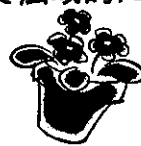
(昨年の花壇づくりの様子)