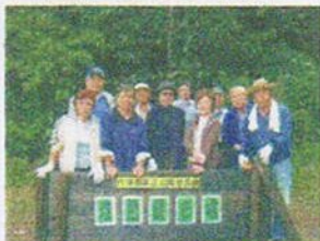
六浦西第三公園愛護会