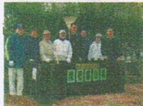
西柴台公園愛護会