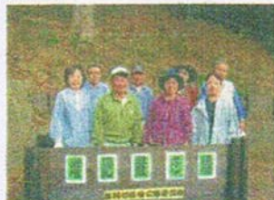
釜利谷赤坂公園愛護会