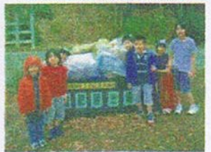
富岡西1丁目公園愛護会